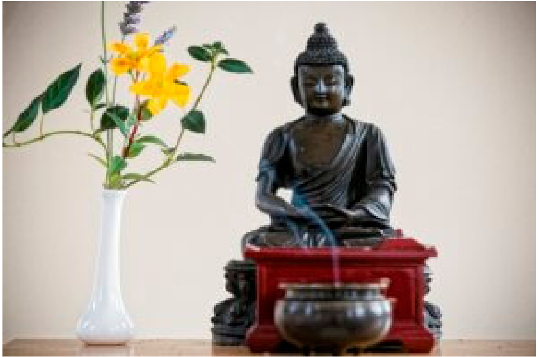
Autel du Zen dojo